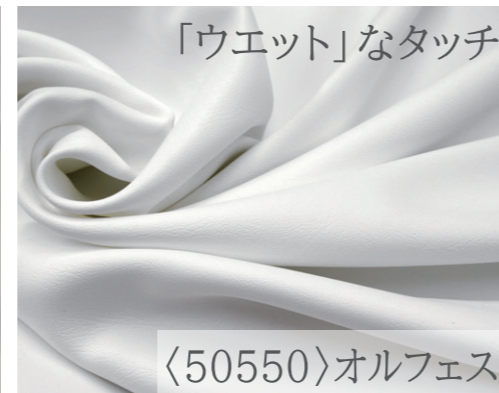
「ウエット」なタッチ